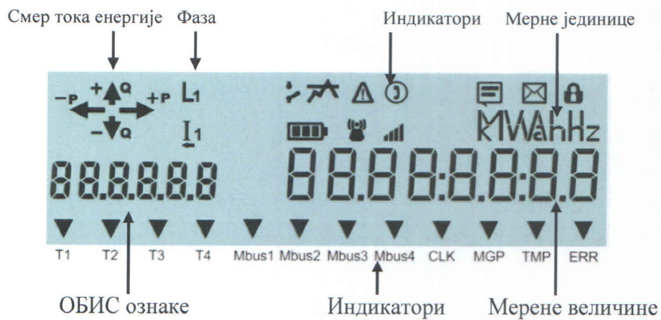
Слика 1. Изглед приказивача бројила